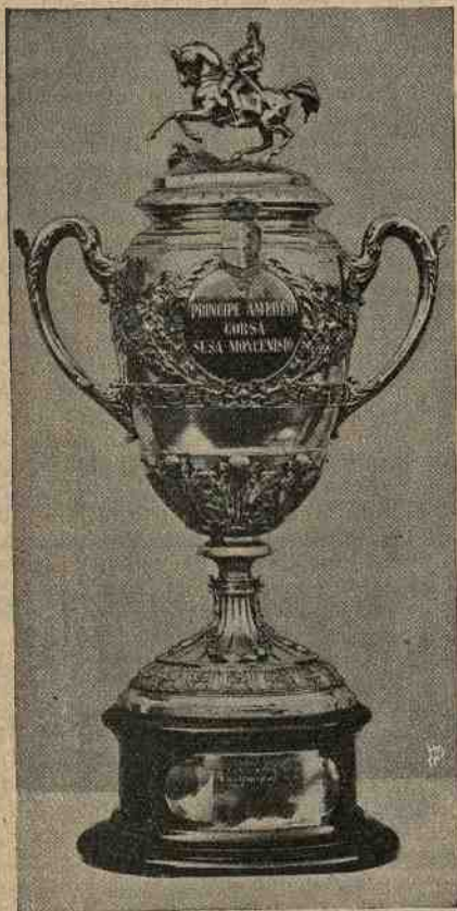
La Coppa Principe Amedeo.