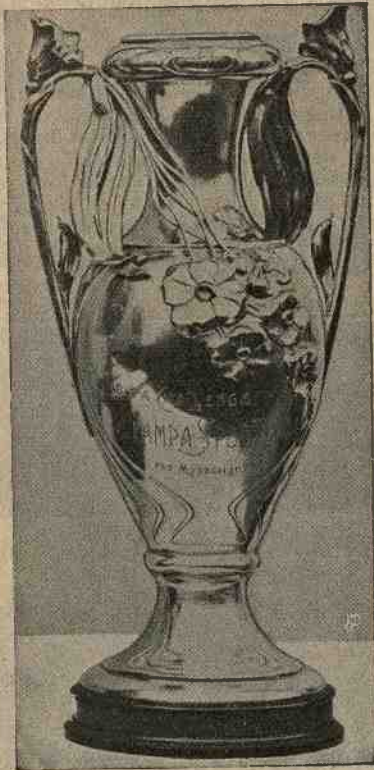
La Coppa Stampa Sportiva, per motociclette.

Tutto il mondo automobilistico italiano rivolge in questi giorni la sua attenzione alla Francia, dove il 26 e 27 corrente si disputerà sul Circuito