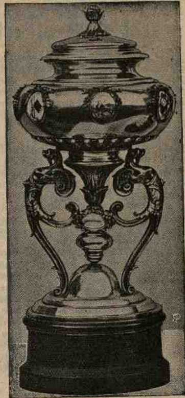
La Coppa Nazionale.

Sappiamo però che alcune fabbriche estere ap-