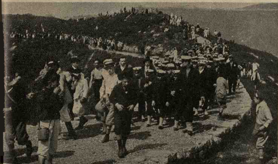
La festa dello Sport Pedestre Genova - Le squadre di ritorno da Sant'Eusebio.