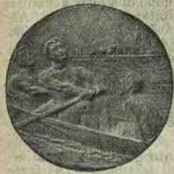
La medaglia conia appositamente per le regate della Sezione Lombardo-Emiliana del R. Rowing-Club d'Italia.

L'età sua di 36 anni, il grado di capitano di complemento di cavalleria, il concetto il più misurato di disciplina e la più