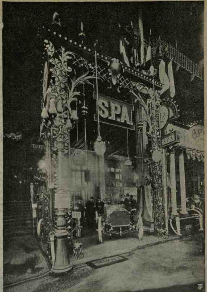
La S.P.A. è la più giovane fabbrica torinese che ha debuttato con l'Esposizione di Parigi, dove ha riportato un successo straordinario.