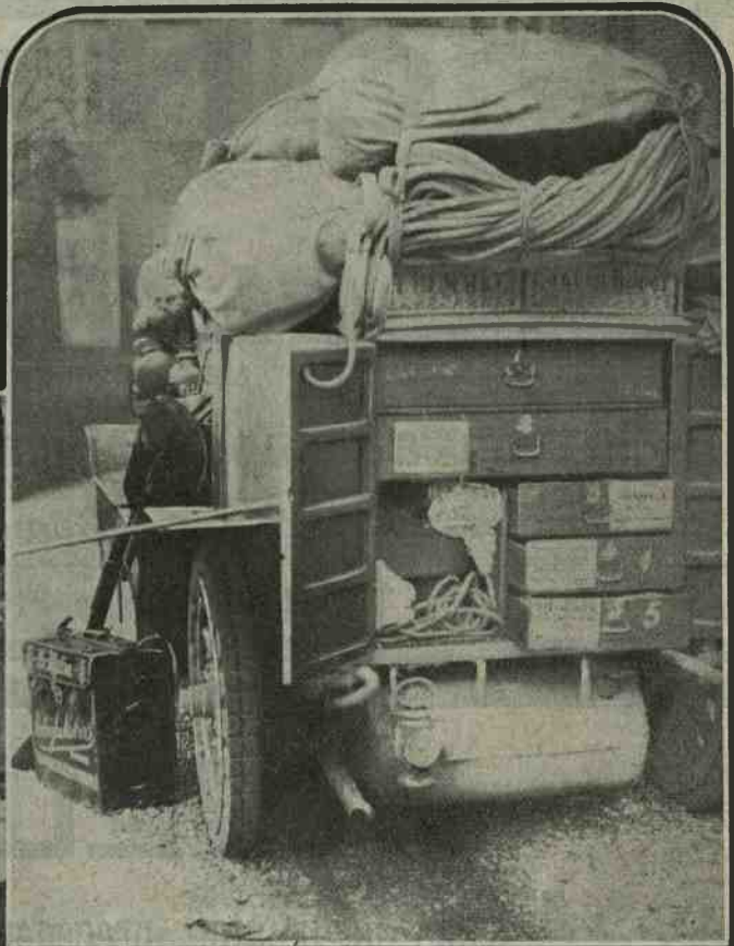
L'armadio posteriore nella vettura di Godard.

nt-Marc) — 58. Ariès III (X...) — 59. Thieulin Cie I (X...) — 60. Thieulin et Cie II (X...). Nessuna riunione internazionale riunì finora un tale numero di concorrenti, pur calcolando che la categoria vetturette — ultima venuta — aprta quest'anno un'accrescita considerevolissima nel numero dei partecipanti.