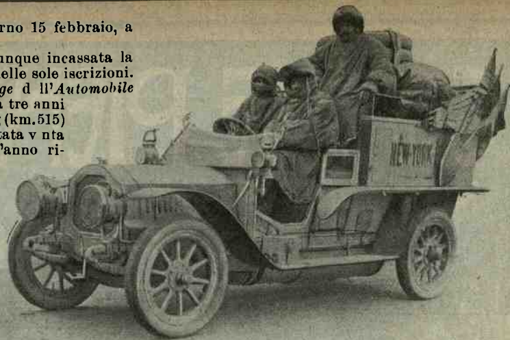
La vettura De Dion Bouton.

Al Circuito di Verona, che si disputerà su 23 km. di spaziose e magnifiche strade il prossimo 15 marzo, in occasione dell'annuale grande fiera dei cavalli, si danno per assicurate le iscrizioni di due vetture Junior, nonché Isotta Fraschini, Fiat, Bianchi, Diatto-Olément, De Vecchi, Strada. La corsa è riservata alle vetture delle tre categ. a quattro cilindri di 110, 120 e 130 mm. di alesaggio.