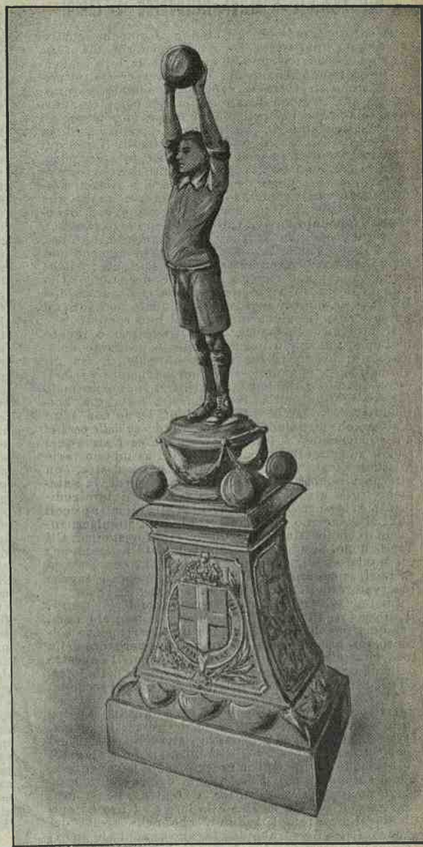
La coppa Lipton, munifico dono del miliardario inglese fatto alla Stampa Sportiva per incoraggiare il foot-ball in Italia.

Un largo servizio d'ordine ci è stato assicurato dall'Autorità di Pubblica Sicurezza e da quella Municipale, sia all'interno che al-