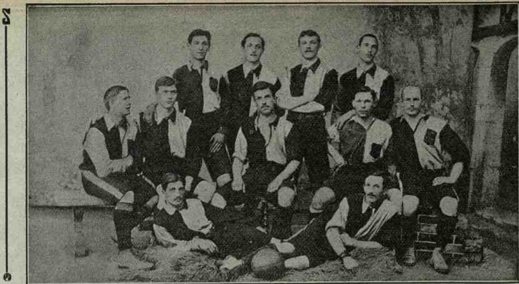
La fortissima prima squadra del Fuss-ball Club Wintertur, che difenderà i colori svizzeri al nostro 2° Torneo Internazionale.

Quest'anno nella squadra delle giovani casacche celesti giocò sempre in porta. Dei suoi momenti più belli ricorda con compiacenza d'esser stato portato in trionfo a Genova, dopo due epici matches vittorio-