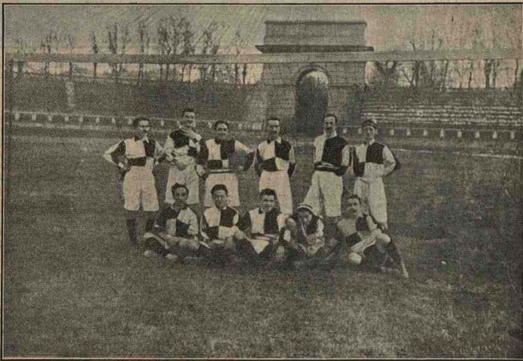
La prima squadra dell' Unione Sportiva Milanese , che rappresenta la Lombardia nel Girone finale dell'attuale campionato.

Nel campo sociale della Società Sportiva Itala , alle Cascine, si svolse domenica scorsa, un interessante match di calcio tra la prima squadra del Foot-ball Club Minerva e la seconda squadra dell' Itala .