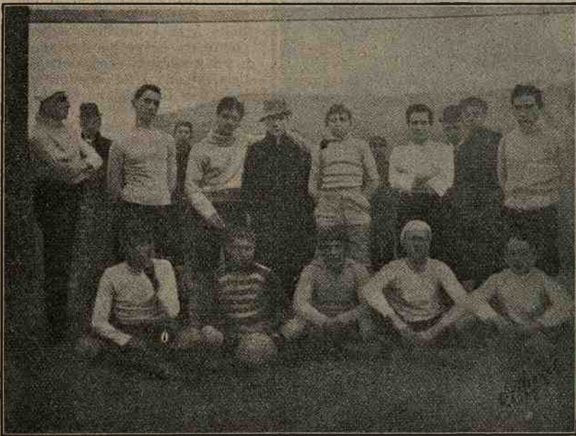
La squadra del R. Liceo Umberto I di Napoli , vincente quella del Liceo G. B. Vico nel match del 10 corr. al Poligono di Bagnoli .

Il Club Sport Veloces ha un bilancio sportivo lusinghiero: il giorno 3 gennaio vinceva per la prima volta la Coppa challenge Excelsior , il 6 la Coppa Bonifacio , il 10 e il 24 è nuovamente vincitrice della Excelsior , dimostrandosi nettamente superiore alle varie altre squadre locali.