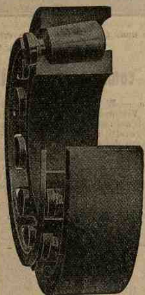
Il rotante completo.

Per Automobili Camions e Omnibus, Motori d'ogni sorta e Cuscinetti.