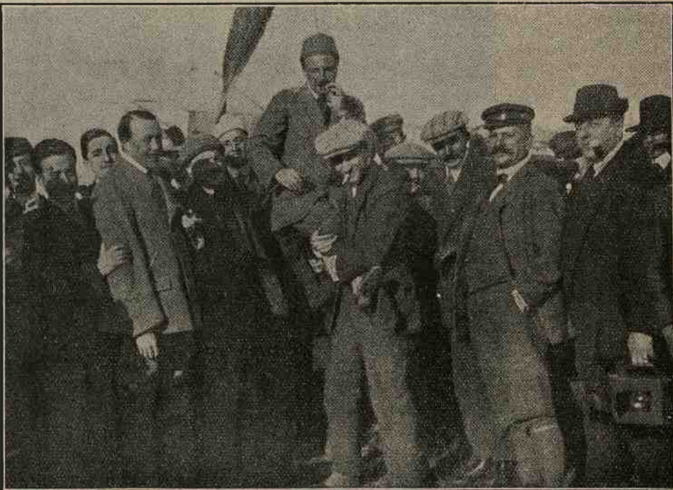
Eros, appena sceso dal suo Farman , dopo aver compiuto felicemente il raid aereo da Torino a Salussola, viene portato in trionfo dagli amici che lo avevano preceduto.

AUTOMOBILISTI! Le vetture Migliori e più Convenienti