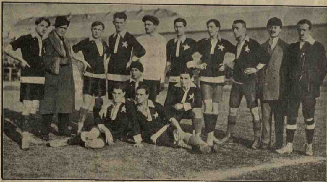
La rivelazione dell'annata: I giocatori casalesi, ottimi debuttanti nel Campionato di quest'anno, ancora domenica scorsa hanno avuto un bel successo facendo match pari col F. C. Torino.