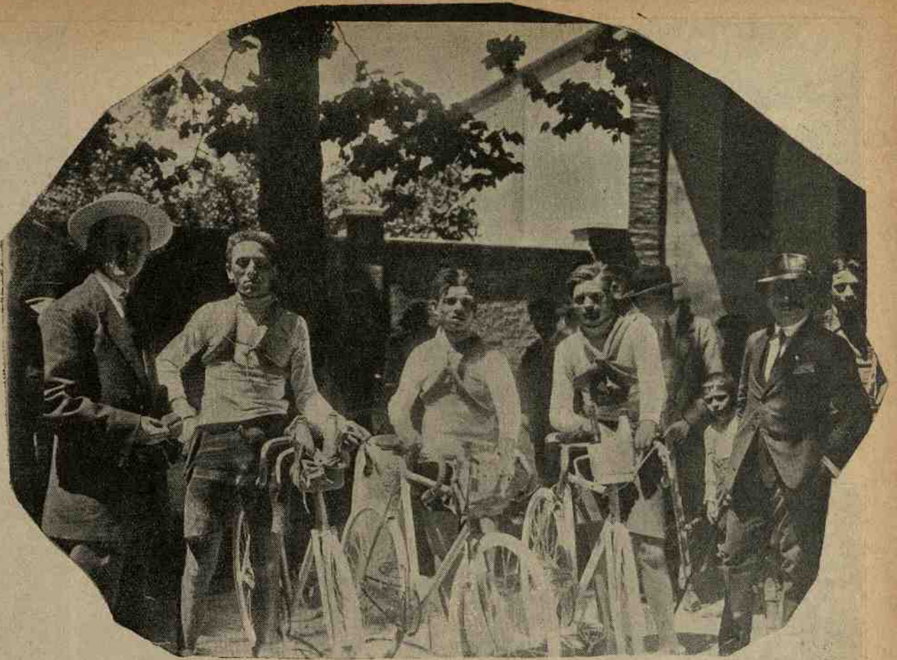
La corsa per la Coppa Modigliani. — La squadra della Pro Gorla, 1 a classificata.

La corsa si è svolta regolare su tutti i 200 km. e con una combattività che forse non ha precedenti, ciò che spiega come il tempo ottenuto dalla squadra vincitrice di domenica costituisca il record del minor tempo impiegato dal 1910 a oggi.