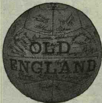
Tuphine - OLD ENGLAND - Tuphine ITALIA-SVIZZERA

L'unico foot-ball Internazionale in Italia nel 1915.