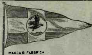
MARCA DI FABBRICA