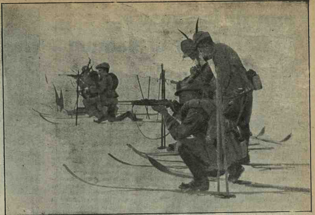
A 8000 metri. — Pattuglia di alpini in ricognizione che fa fuoco sugli austriaci.