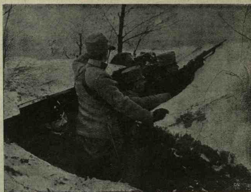
Gli austriaci sugli spalti delle più alte vette che vanno abbandonando man mano che vengono espugnate dalle nostre eroiche truppe.

I pasti caldi consistono oggi sopra tutto in cavallo bollito, fagioli, zuppa di riso o di pasta con piccoli e rari pezzi di pesce. Un altro privilegio, quello della spedizione ai soldati di pacchi di viveri, fu di recente abolito, evidentemente allo scopo di impedire alla popolazione civile di privarsene. I soldati in permesso hanno invariabilmente il viso pallido a causa della insufficienza del nutrimento. L'artiglieria tedesca manca assolutamente di cavalli e ultimamente fu necessario ridurre gli attacchi a quattro cavalli per cannone e a due cavalli per ogni cassone di munizioni.