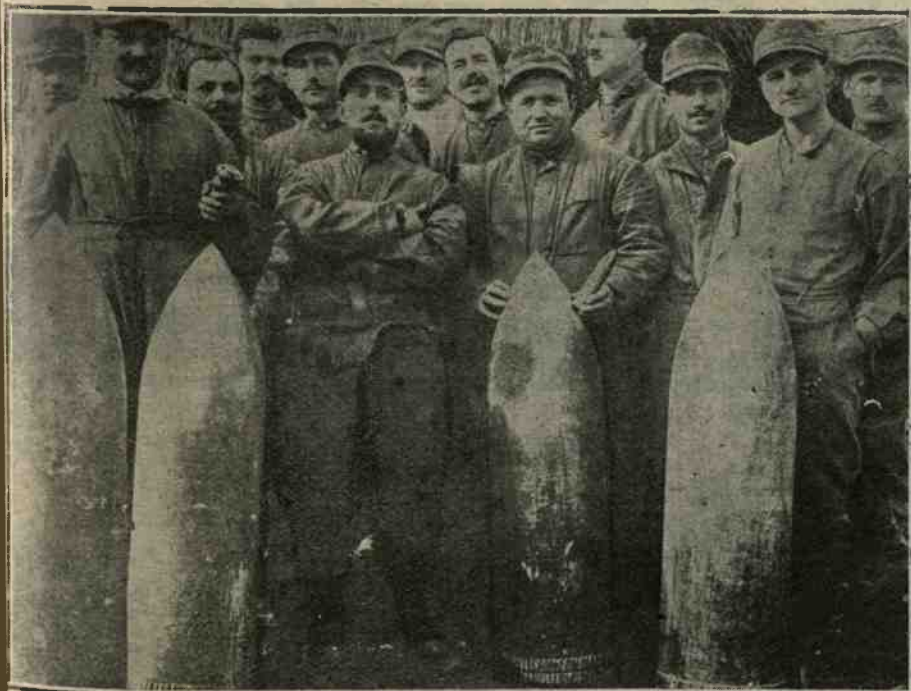
Granate austriache da 305 inesplose.

flotti di sangue, i primi non impediranno i secondi e la guerra continuerà accanita perchè è in lotta non una dinastia contro l'altra, ma un popolo contro l'altro, ma un principio contro l'altro. Il Re di Baviera ha in questi giorni rivolto ad una deputazione che lo felicitava per il centenario del ritorno del Palatino sotto la Casa Wittltsbach una delle solite allocuzioni battagliere e che dimostrano come si sia ancor troppo lontani dalla pace.