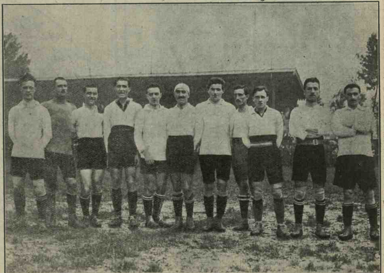
Match a Torino - Piemonte Liguria contro Lombardia. - La squadra vincente del Piemonte Liguria.

Girando in curva, i leaders accelerano, ma il treno appare piuttosto lento, nè si delineano notevoli spostamenti. E' solo al filare dei pioppi, prima delle penultima curva, che la vera corsa comincia. Sono sempre in testa Filon d'Or e Sun Star, ma girando nella drittnra, i cavalli francesi cedono e ben presto appaiono superati, mentre passa al comando Tronador, cui si attaccano Hamisi e Idolo: il resto del lotto si sgrana rapidamente intanto che fra i tre cavalli alla testa si impegna una lotta vivace. Alla distanza, Idolo è battuto. Affiancati, Tronador e Hamisi sono alla