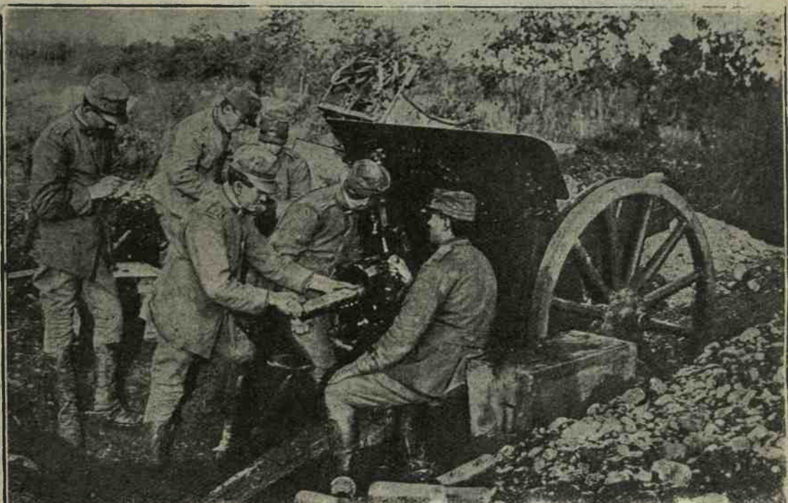
La nostra artiglieria. — Caricamento di un pezzo d'artiglieria da 75.