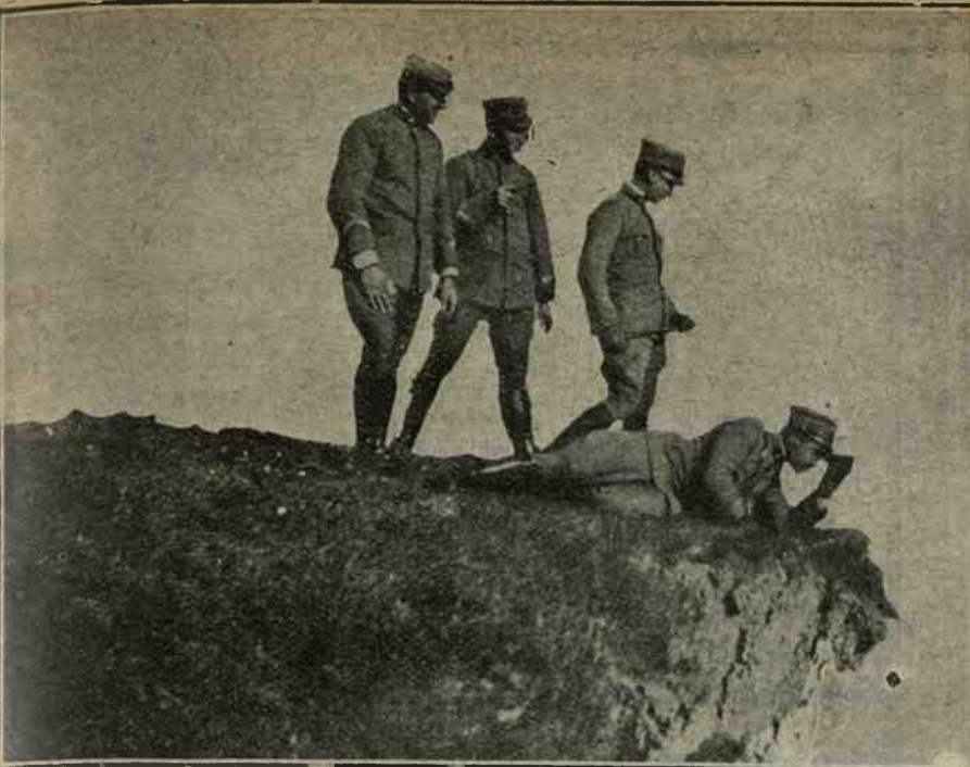
Ufficiali che osservano gli effetti dei tiri delle nostre artiglierie..

resipiscenza alcuna al riguardo. Ci sarebbe da sperare nel popolo tedesco — e qualche movimento in proposito abbiamo potuto osservarlo in queste ultime settimane — ma per quanto se ne possa sapere delle condizioni interne di un paese non se ne sa mai abbastanza. e la storia ci ha spesso narrato di moti popolari sviluppatisi quanto meno si potessero aspettare. Quale adunque la conclusione? Ce l'ha data il giornale francese da noi citato in principio di queste note: flotti di inchiostro..... e