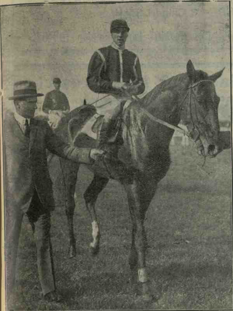
Il « Gran Premio del Commercio » a S. Siro (Milano). - Il vincitore Tronador.

L'arrivo avviene in questo ordine: 1° Tronador; 2° per un'incollatura Hamisi; 3° a quattro lunghezze Idolo; 4° Osmaston, N. P. Xilophane, Sun Star, Qui-