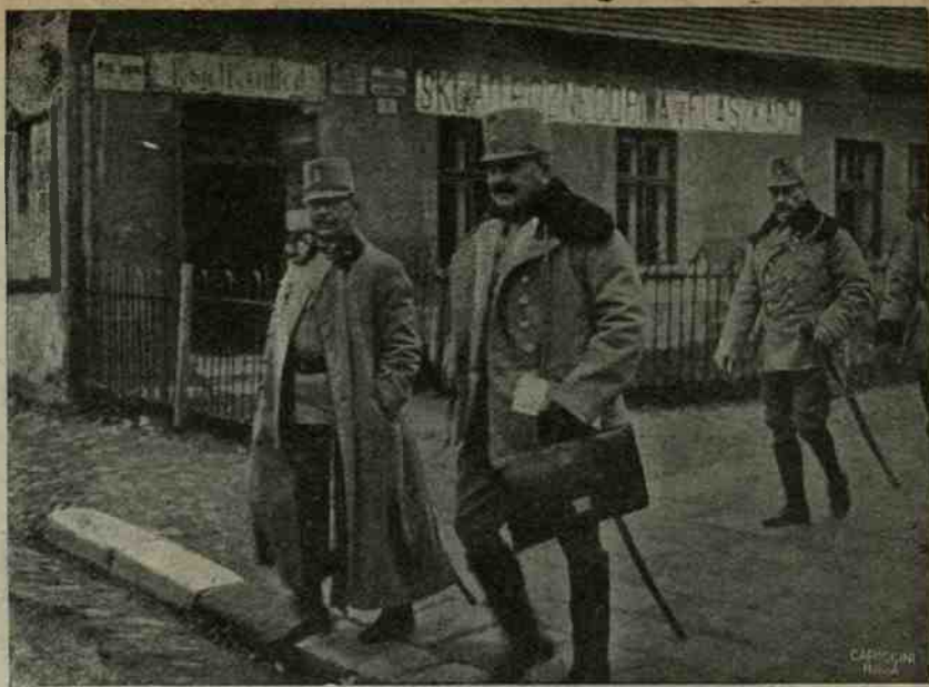
I. generale austriaco Konrad, comandante le truppe operanti contro l'esercito italiano.

La razione del soldato tedesco cominciò ad essere diminuita sei settimane fa. La carne diventa un alimento rarissimo; tra le truppe ne vengono distribuiti piccoli pezzi soltanto di tratto in tratto. La razione quotidiana di pane è soltanto di tre quarti