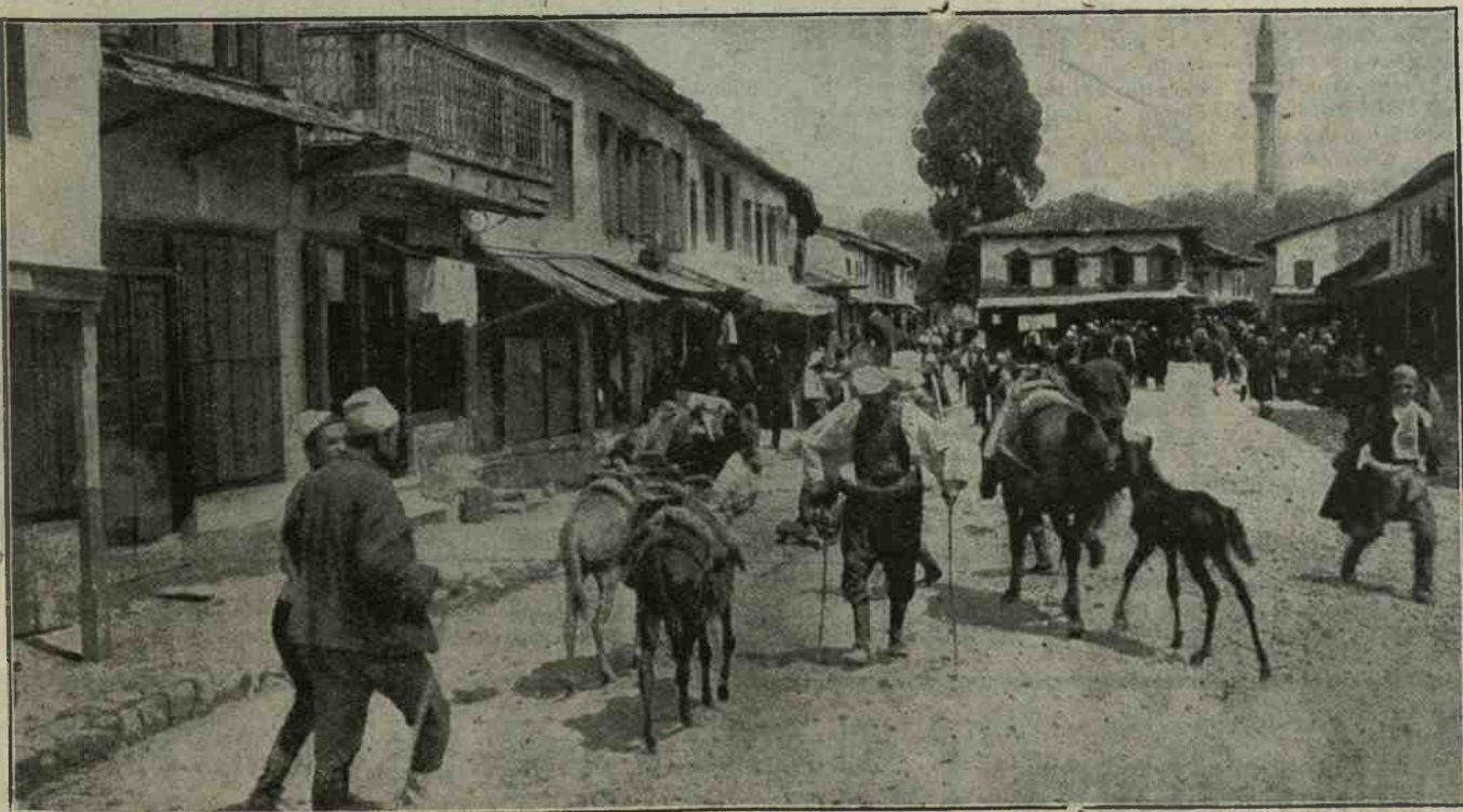
La nostra spedizione in Albania. — Una via di Valona: E la città ha ripreso come per incanto il suo movimento abituale sentendosi sicura da ogni sorpresa guardata com'è dall'occhio potente delle navi da guerra italiane ancorate nella rada.