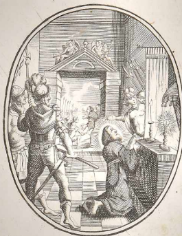
S. Francesco di Paola facendo orazione si rende Inuincibile a cinquanta soldati, che il Re di Napoli inuio per farlo prigione