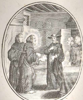
S. Francesco di Paola alla presenza d' un Cameriero del papa tiene nelle mani accesi Carboni per testificarli praticabile la sua Regola