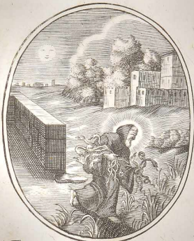
S. Francesco di Paola con le proprie mani trasporta quantità di serpenti, che infer- tauano li Operarij del Conuento di Tors