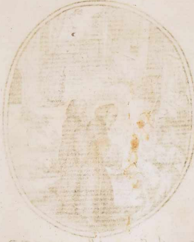
Il terzo è il Re di Portogallo che si presenta a Dio per la sua corona e per la sua gloria e per la sua gloria e per la sua gloria