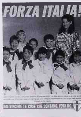
Democrazia Cristiana (1987)