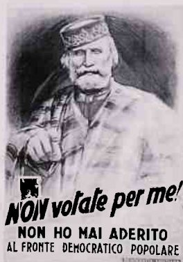
Democrazia Cristiana (1948)

c) La storia e l'attualità dei movimenti sociali sono oggetto di ricerche avviate dall'archivio sui movimenti ambientalisti, di un'analisi dei manifesti politici come strumento di comunicazione di massa, di un progetto di casa degli archivi sindacali e d'impresa, parte di un 'museo del lavoro' per Torino. Il ricco