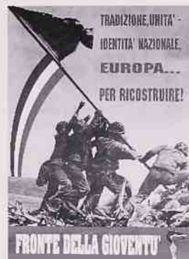
Fronte Nazionale della Gioventù (F.N.G.)