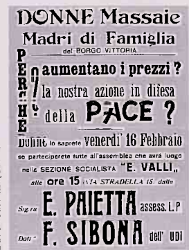
Udi d' Torino (1951)

8 marzo Dibattito, in collaborazione con: Autoconvocati '94, Comitato per la Costituzione "Cittadini non sudditi"