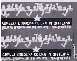
Lotta Continua (1970)