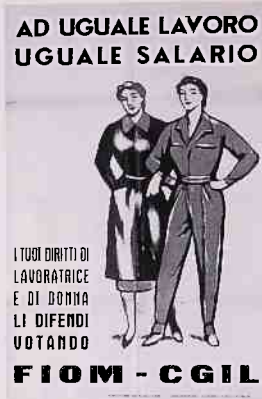
F. am. - C. Idi Torino (1953)

patrimonio di volumi e fonti di storia sociale della biblioteca viene valorizzato dal suo inserimento nel Sistema Bibliotecario Nazionale. Viene inoltre attivato un seminario permanente sulle relazioni industriali e di lavoro che prosegue un rinnovato interesse per l'analisi delle trasformazioni in atto nel mondo del lavoro e nelle sue classi dirigenti.