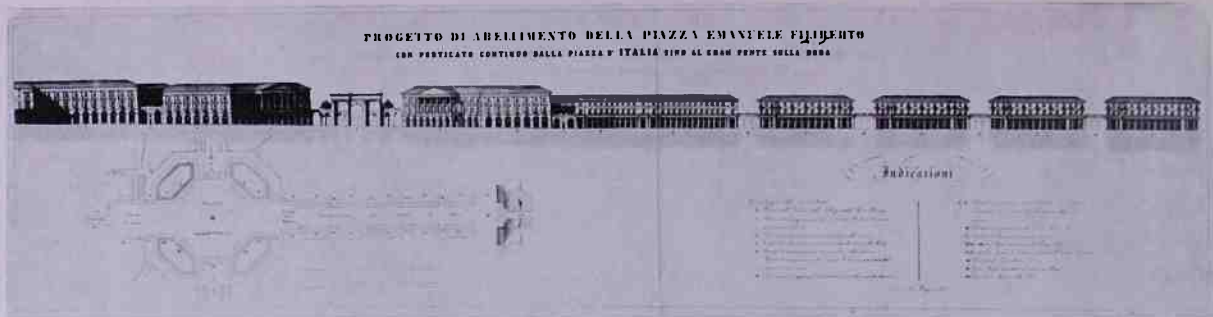
Fig. 4. - Progetto di Abellimento della Piazza Emanuele Filiberto / con porticato continuo dalla Piazza d'Italia sino al gran Ponte sulla Dora, Torino, 20 Maggio 1832. (Torino, Archivio Storico del Comune).