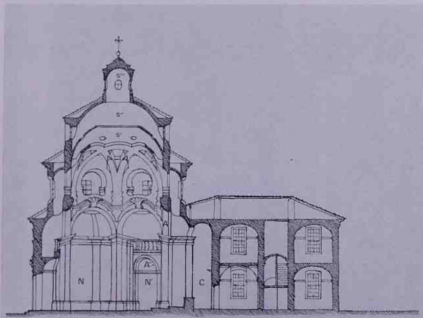
Fig. 6 - Sezione totale (rilievo).