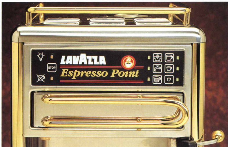
Il pannello di controllo dell'Espresso Point Vapore

veloce come il TGV, soggetto a frequenti microinterruzioni di corrente (sono quindici sulla sola tratta Parigi-Lione!), la macchina è dotata di una batteria autonoma e del resettaggio automatico che impediscono la perdi-