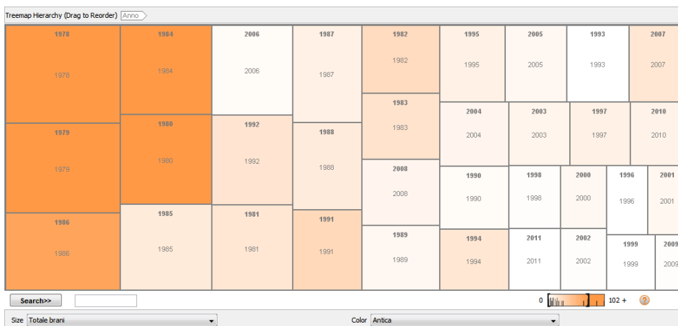
FIGURA 7 - QUANTITÀ DI BRANI SUONATI OGNI ANNO CON COLORAZIONE DEI BRANI DI MUSICA ANTICA

Un'altra rappresentazione del fenomeno è mostrata nelle figure seguenti, nelle quali per ogni genere (Antica, Barocca, Classica, Contemporanea e di Avanguardia) si hanno queste informazioni: i rettangoli con dimensione maggiore sono le edizioni con più brani suonati, mentre il colore più intenso indica che, rispetto al totale dei brani suonati in quell'edizione, sono stati suonati più brani di quel genere di musica.