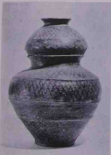
Urna cineraria protostorica decorata a « stralucido » - Torino, Museo di Antichità.

Nelle sepolture si deponevano i defunti su terra rossa, fratturando e ripiegando le gambe, senza tinger di ocre il corpo, com'era invece usanza ligure. Sono da segnalare monumenti megalitici, di significato incerto (tombe? altari? segnali?) come i « cromlechs » al Piccolo S. Bernardo, a S. Didier, Champorcher, Cogne; i « dolmen » al Gran San Bernardo, a Torgnon e altrove; monoliti — a differenza dei tumuli di piú elementi, propri delle stirpi germaniche — si vedono nelle « pietre del fuoco » a Nei-